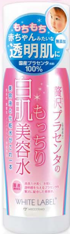
白拉贝 柔肤精华液