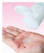
浓稠的精华液瞬间即可渗透肌肤内部!

美容液的浓缩营养素, 瞬间渗透肌肤内部。也适用于颈部的使用, 还可以润湿化妆棉贴在脸上作面膜。