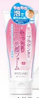
白拉贝 柔肤洁面乳